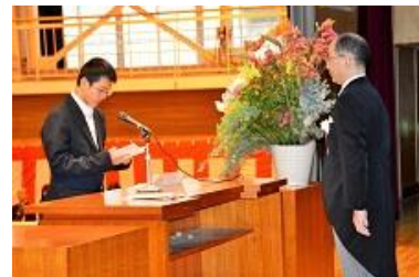
平成31年度入学式 新入生代表の言葉